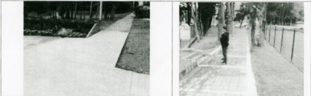
VISTA RECUPERACIÓN ZONAS DURAS EN CONCRETO Y ANDENES EN ADOQUIN TIPO LADRILLO