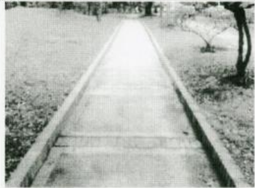
VISTA RECUPERACIÓN ANDENES EN CONCRETO CON CENEFAS Y BORDILLOS EN ADOQUIN TIPO LADRILLO