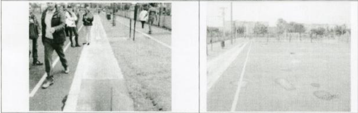
VISTA CUNETA RECUPERADA PARA RECOLECCION DE AGUAS LLUVIAS