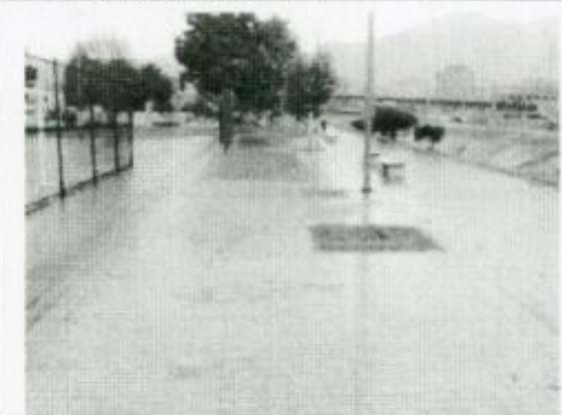
VISTA TRAMO RECUPERADO EN ADOQUIN TIPO LADRILLO PRENSADO