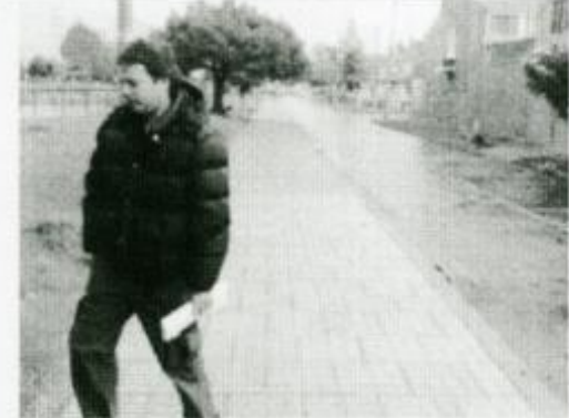
VISTA RECUPERACIÓN TRAMOS EN ADOQUIN Y BALDOSA DE CEMENTO