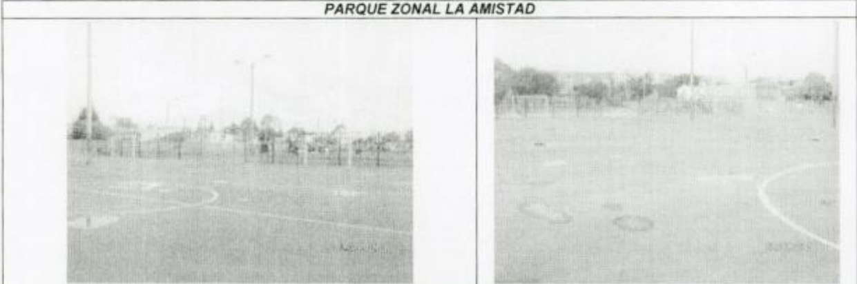
VISTA CANCHAS RECUPERADAS EN EL MANTENIMIENTO